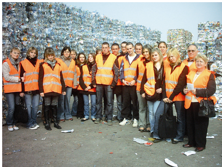
Les élèves du lycée au centre de tri d'Amiens