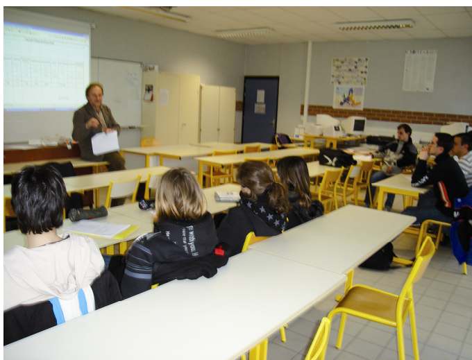
Lycée de l'Authie, la classe de Bac Pro secrétariat