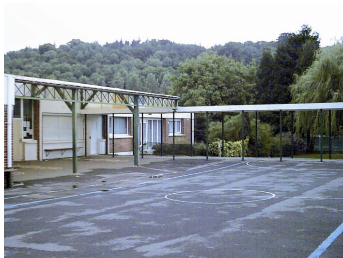
L'école primaire de Pas en Artois

Les questions ont fusé de toutes parts, elles furent très pertinentes et très précises. Ensuite, avec beaucoup de bon sens, les enfants ont pu mettre en pratique ce qu'ils venaient d'apprendre. Tous les enfants ont été surpris que les adultes puissent jeter dans la nature autant de déchets, alors que les poubelles sont ramassées chaque semaine.